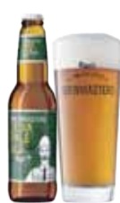
BREWMASTERS INDIA PALE ALE

Brewmasters Collection India Pale Ale er en ravgylden ale med en frisk humleduft, en velbalanceret smag og en god efterbitterhed.