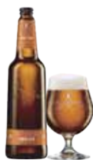
JACOBSEN PALE ALE

Forfriskende Pale Ale med indbydende blomstret duft af appelsin- og hyldeblomst.