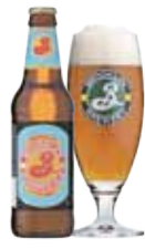
BROOKLYN SUMMER ALE

Brooklyn Summer Ale er forfriskende klassisk pale ale. Maltfylden balanceres af humle, der bidrager med et indbydende duftbillede.