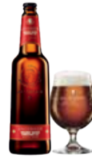
JACOBSEN GOLDEN NAKED CHRISTMAS ALE

Brygget som en rigtig nordisk juleøl tilsat julens krydderier. Smagen er rund med en moderat fyldighed.