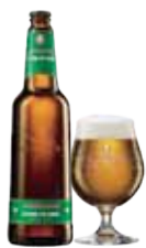
JACOBSEN EXTRA PILSNER

Økologisk øl med en markant bitterhed, som går godt i spænd med aromaer af abrikos og jordbær.