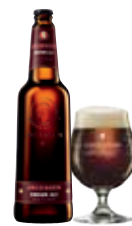
JACOBSEN BROWN ALE

Overgæret øl efter engelsk tradition. En middelfyldig øl med en frugtagtig karakter.