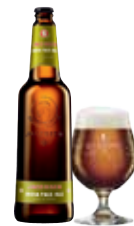
JACOBSEN INDIA PALE ALE

Alkoholprocent: 6,0 33/75 cl fl, 20 l MD / 25 l Stål