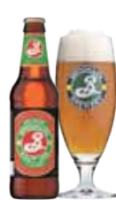
BROOKLYN EAST IPA

Er velhumlet med rige noter af hylde og citrus.